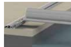
binari da avvitare sul bordo rails to screw on the edge