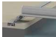
binari incastrati sul bordo Rails fitted on the edge