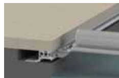
binari aggancio hung sotto bordo Hung hooking rails under edge